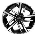
17" ar diamantu griezti vieqlmetāla diski