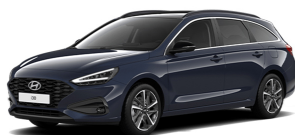
Sailing Blue Pearl