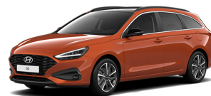
Juniper Orange Metallic