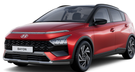
Dragon Red Pearl / Black roof