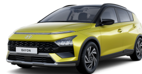
Lucid Lime Metallic / Black roof