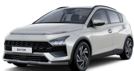
Lumen Gray Pearl