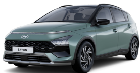
Green Pearl / Black roof