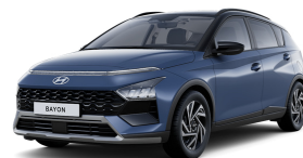
Vibrant Blue / Black roof