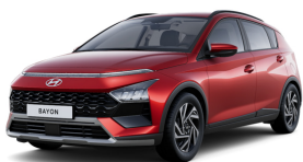
Dragon Red Pearl