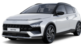
Atlas White / Black roof