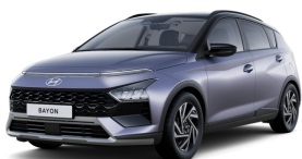
Meta Blue Pearl / Black roof