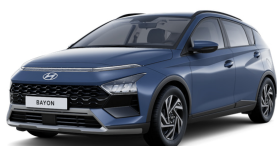
Vibrant Blue Pearl

NB! Ņemiet vērā, ka attēliem ir tikai ilustratīva nozīme. Automašīnas aprīkojums, tai skaitā jumta krāsa, sānu spoguļi, jumta reliņi, riteņu diski, aizmugurējie logi u.tml. var atšķirties atkarībā no izvēlētajā aprīkojuma līmeņa.