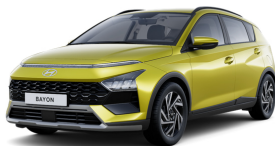
Lucid Lime Metallic