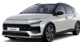
Lumen Gray Pearl / Black roof