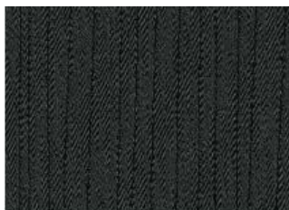
N-Connecta Black – auduma apdare