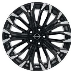
Tekna 19" ar dimantu slīpēti vieglmetāla diski