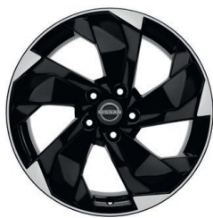
N-Connecta 18" vieglmetāla diski