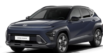
Denim Blue perlamutra (TN0) / melns jumts