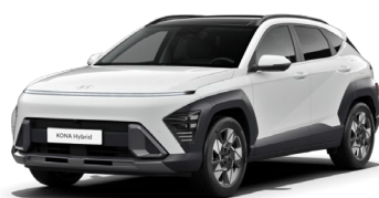
Atlas White (SAW)