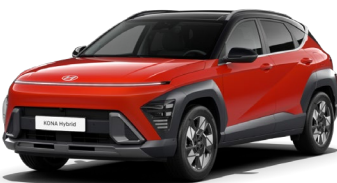
Soultronic Orange perlamutra (S00) / melns jumts*