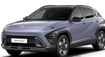
Meta Blue perlamutra (PM0) / melns jumts*