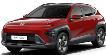
Ultimate Red metāliska (R2P)