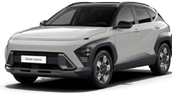
Cyber Grey metāliska (C50) / melns jumts