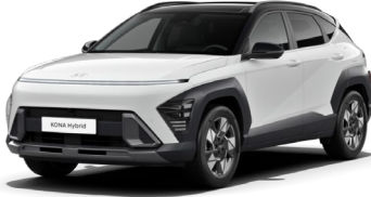
Atlas White (SA0) / melns jumts

Phantom Black – melns jumts Phantom Black – melns jumts 590 €