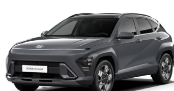
Ecotronic Gray perlamutra (PE2)