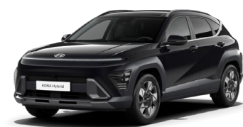
Abyss Black perlamutra (A2B)

Mirage Green nemetāliska – bez maksas 0 € Metāliska un perlamutra krāsa 550 €