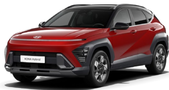
Ultimate Red metāliska (R20) / melns jumts