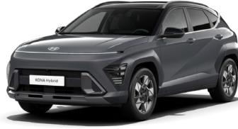
Ecotronic Gray perlamutra (PE0) / melns jumts