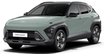
Mirage Green (RR0) / melns jumts