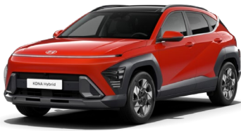
Soultronic Orange perlamutra (SOP)*