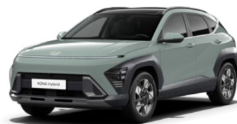
Mirage Green (RRR) - bez maksas