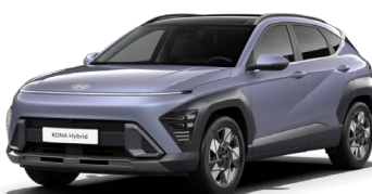
Meta Blue perlamutra (PM2)*