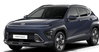
Denim Blue perlamutra (TN6)