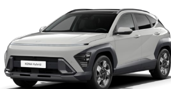
Cyper Grey metāliska (C5G)