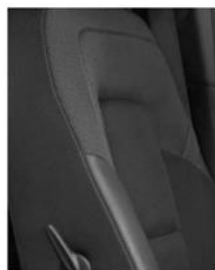
Тканевая обивка сидений — премиум