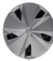
Колпаки на 16" стальные колеса

*Вариант цвета доступен только с черными бамперами. Цвета ориентировочные.