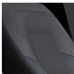
Тканевая обивка сидений — стандарт