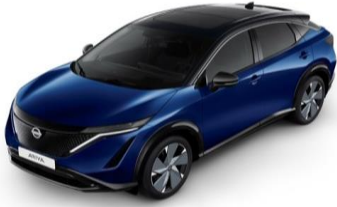
XGU Blue Pearl / Black