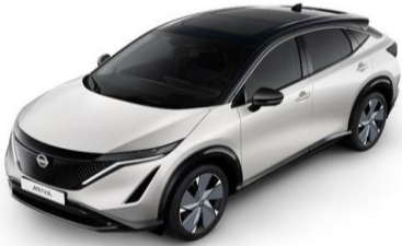
XGA White Pearl / Black