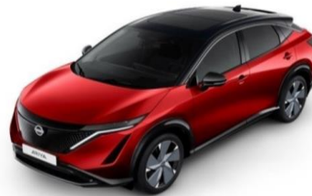
XGD Tinted Red / Black