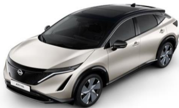
XGV Warm Silver / Black