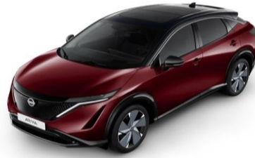
XGG Burgundy / Black