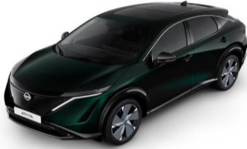
DAP Aurora Green