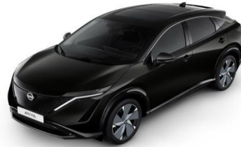
GAT Pearl Black