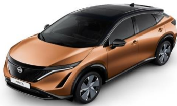
XGJ Akatsuki Copper / Black