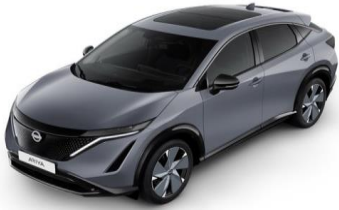
KBY Ceramic Grey