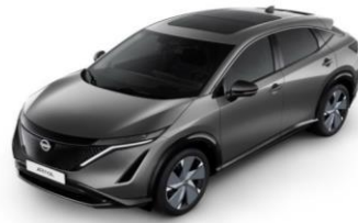
KAD Gun Metallic